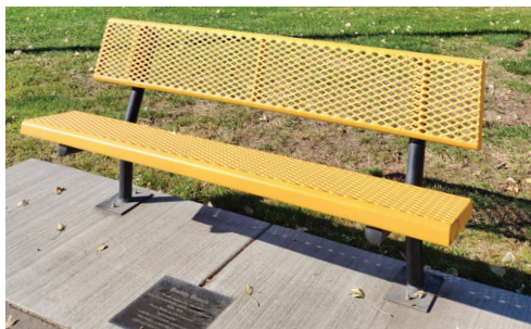
Las bancas de amigos alrededor de Mountain Home le hacen saber a las personas que no están solas.

En nuestra comunidad, hay ESPERANZA y hay AYUDA. Este folleto puede ser un buen lugar para comenzar.